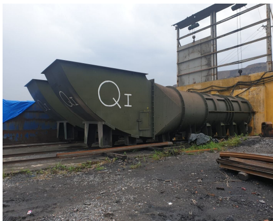
Hình 4. Hình ảnh chung trạm quạt FBDCZ.No 22, mức +30 m