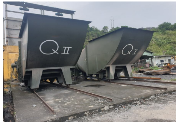
Hình 3. Hình ảnh chung trạm quạt FBDCZ-No27 mức +17 m