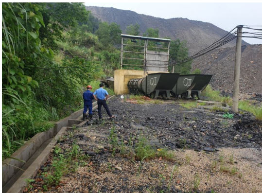
Hình 2. Hình ảnh chung trạm quạt FBDCZ- No22, mức +35 m

- Chất lượng thông gió của các lò chợ và lò chuẩn bị cơ bản đáp ứng yêu cầu, ở một số lò chợ