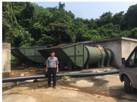
Hình 5. Hình ảnh chung trạm quạt FBDCZ- No14, mức +27 m